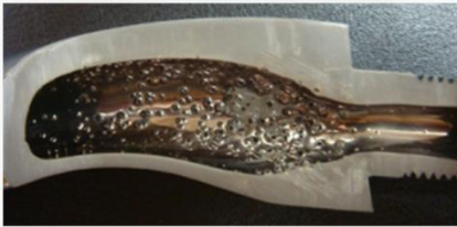
改善前 内部発泡の様子

トイレのタンクに付いている「手洗い金具」。最近では、これが樹脂製であることを知る人も増えていきますね。弊社ではこの給水部と根元のネジ部を一体化して水漏れや錆びの発生を防止することに成功しています。また、内部の様子はなかなか見ることが難しいのですが、管の中は下図のようになっていて内部発泡があると水垢が付着しやすくストレスクラックの原因にもなるという考え方もあります。