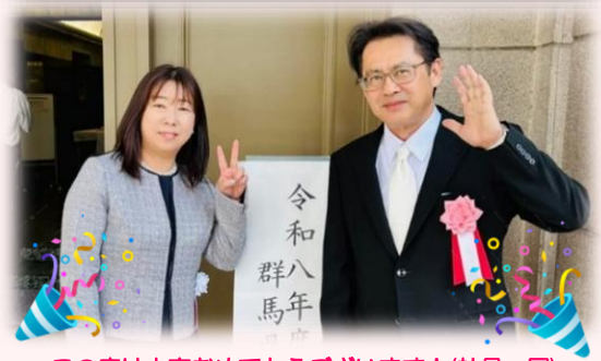
この度は大変おめでとうございます！（社員一同）