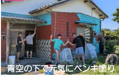
青空の下で元気にペンキ塗り