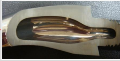
改善後 水流がなめらかに

ガスインジェクションやヒート&クールの技術を駆使した、ヒケや反り、ウエルドの改善など他にもできることがたくさんありますのでお困りごとがございましたら是非弊社にご相談くださいませ。