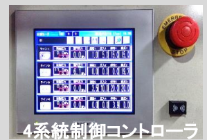
4系統制御コントローラ