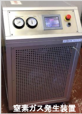
窒素ガス発生装置