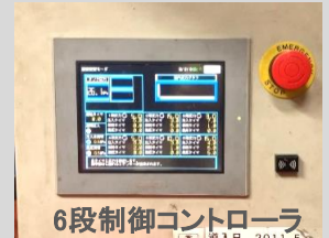
6段階制御コントローラ