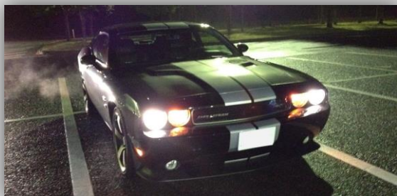
6400cc 470馬力の暴力的な加速...あっという間に200km/h そんな車に乗る社長はゴールド免許歴25年

クイズ：この車は何というの？ ① フォード マスタング ② シボレー カマロ ③ ダッジ チャレンジャー