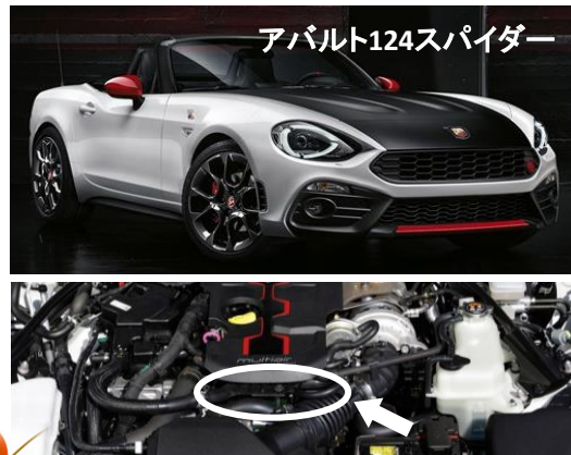
アバルト124スパイダー